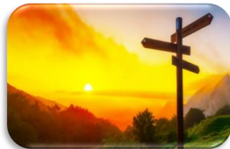
Figura 1: https://www.elloinsights.com/wp-content/uploads/d.jpg